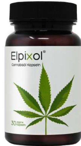
Elpixol Cannabis Kapseln Inhalt: 30 Stk. PZN: 18319133