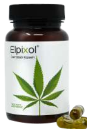
Elpixol Cannabisöl Kapseln 30 St. PZN: 18319133 UVP: 17,95 €