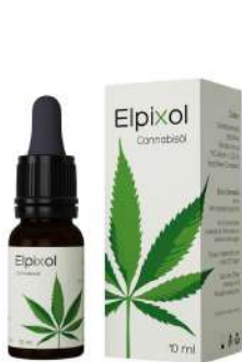
Elpixol Cannabisöl Tropfen 10 ml PZN: 16612550 UVP: 19,99 €