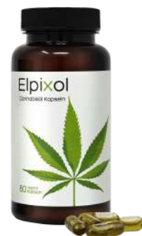
Elpixol Cannabisöl Kapseln 60 St. PZN: 17902764 UVP: 29,95 €