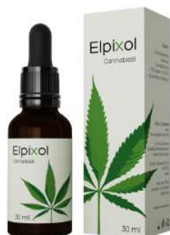
Elpixol Cannabisöl Tropfen 30 ml PZN: 16612544 UVP: 39,99 €